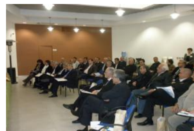
Επαναφορά στην Αρχική Σελίδα